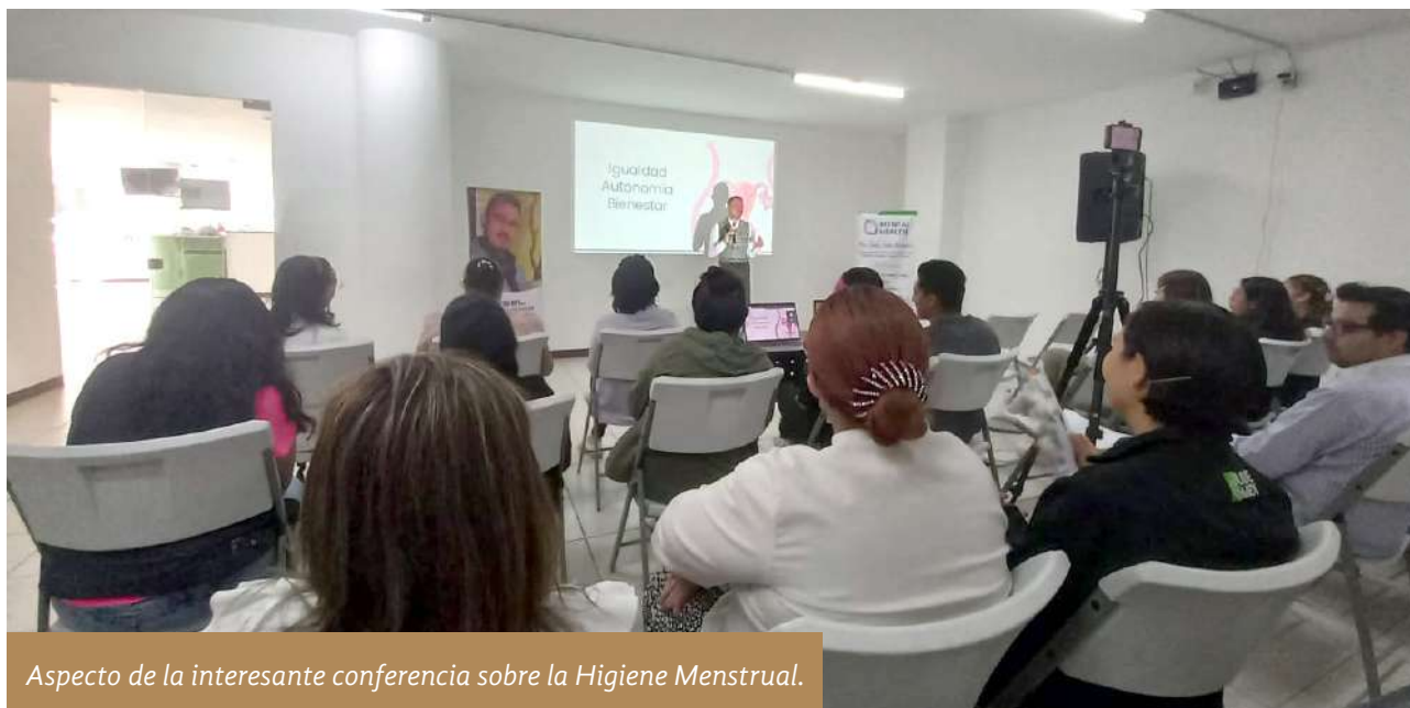
Aspecto de la interesante conferencia sobre la Higiene Menstrual.

Se tocó el tema de los derechos sexuales, que consisten en poder decidir de manera libre e informada sobre la vida reproductiva, así como tener acceso a información actualizada, veraz, completa, científica y laica sobre sexualidad. Es importante que se garanticen los derechos de igualdad, autonomía y bienestar de las personas menstruantes.