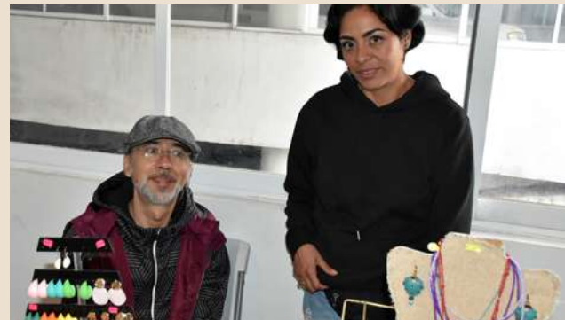
Ilustración 14. Entusiastas emprendedores presentes en la 3ª Edición del “Mercadito UDEMEX”.