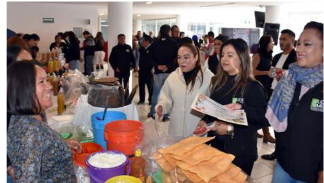
Ilustración 9. Autoridades de la institución conversando con los expositores.

En esta ocasión, se dieron cita 17 expositores, quienes llevaron sus productos para ofrecerlos al personal de la UDEMEX, así como a familiares y público en general. Los productos que se ofrecen son de lo más variado, ya que van desde alimentos y bebidas hasta artesanías de detallada elaboración, como manualidades de fieltro, textiles, moños artesanales, figuras miniatura, artículos de papelería, bisutería y velas aromáticas, entre otros.