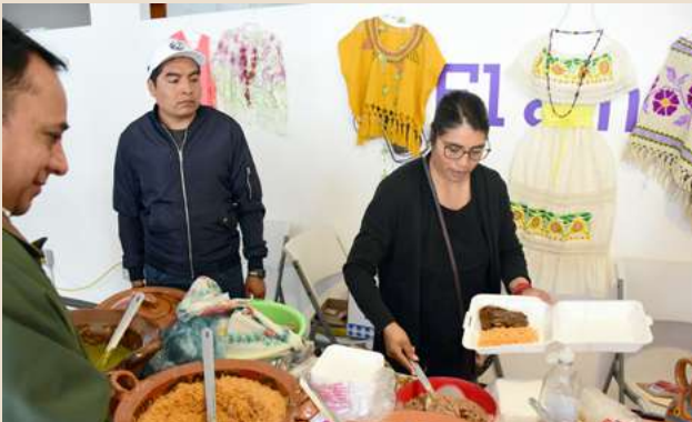
Ilustración 19. El 3er. “Mercadito UDEMEX” es un reconocimiento a los artesanos y emprendedores.