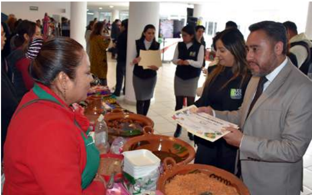
Ilustración 8. Entrega de reconocimiento por autoridades.

En esta ocasión, se dieron cita 17 expositores, quienes llevaron sus productos para ofrecerlos al personal de la UDEMEX, así como a familiares y público en general. Los productos que se ofrecen son de lo más variado, ya que van desde alimentos y bebidas hasta artesanías de detallada elaboración, como manualidades de fieltro, textiles, moños artesanales, figuras miniatura, artículos de papelería, bisutería y velas aromáticas, entre otros.