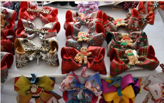
Ilustración 13. 3er. “Mercadito UDEMEX”, todo un éxito.