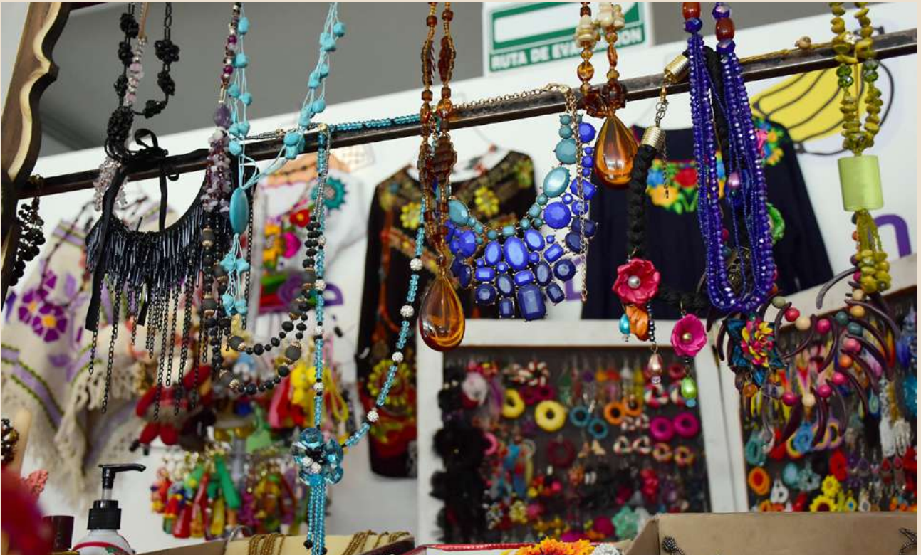
Ilustración 16. Bellos productos artesanales de todo tipo, como collares, anillos y aretes.