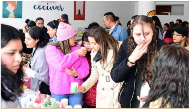
Ilustración 7. Aspectos del evento.