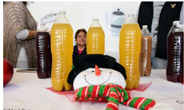
Ilustración 18. No podían faltar los alimentos y bebidas. ¡Todo delicioso!