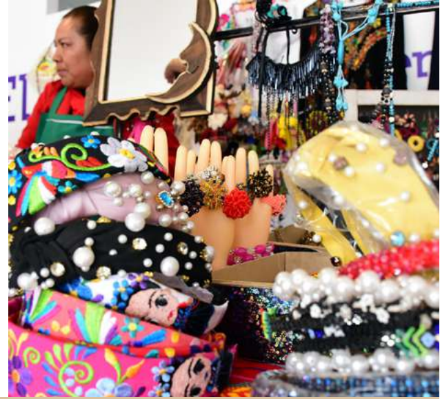
Ilustración 20. Entusiastas emprendedores presentes en la 3ª Edición del “Mercadito UDEMEX”.

El “Mercadito UDEMEX” es un reconocimiento a los artesanos y emprendedores del Estado de México quienes, con talento, innovación y creatividad, llevan a la comunidad diferentes productos, fortaleciendo su posicionamiento y desarrollo en el mercado.