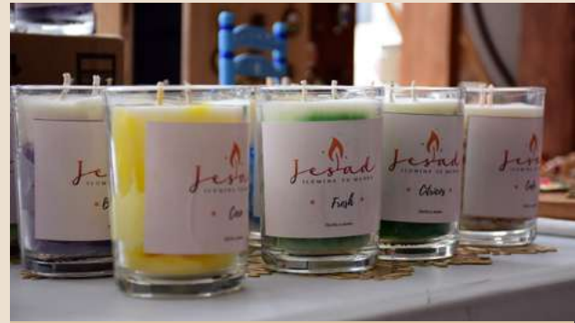
Ilustración 12. Velas aromáticas.