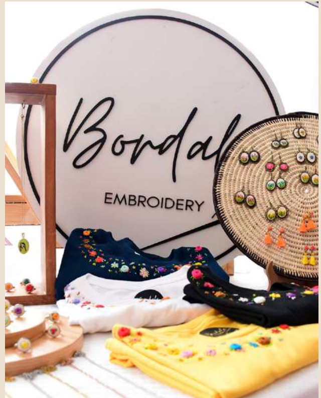
Ilustración 17. 3er. "Mercadito UDEMEX", todo un éxito.