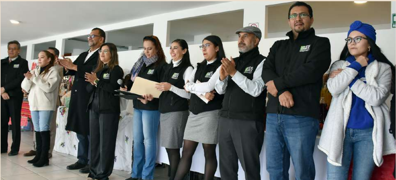
Ilustración 3. Personal de la universidad en la inauguración del 3er “Mercadito UDEMEX”.