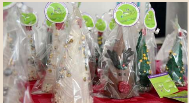
Ilustración 15. Bonitos productos artesanales exhibidos en el “Mercadito UDEMEX”.