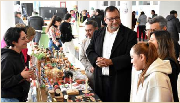
Ilustración 11. Autoridades recorriendo los stands del evento.