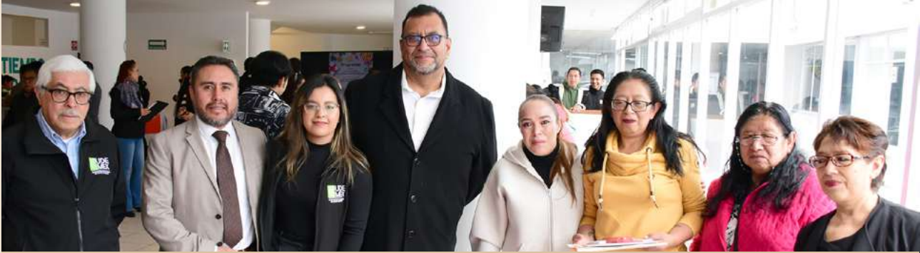
Ilustración 10. Autoridades con participantes del “Mercadito UDEMEX”.